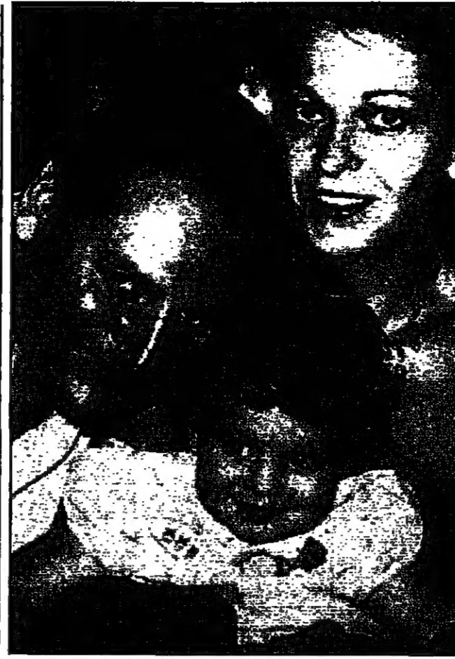
كارلوس مع ماله في صورة قد تم تكريه في المستقبل

باريس - القدس العربي - ولما لوجود تعارض بين مهته الحالية وعمله السابق كقاضي تحقيقات. وبعد كارلوس بأن كورنيلو شاركه في عملية تجريب بطعم غير أنه في باريس أصيب فيها رويديسي، وعقب كورنيلو أيضا في تجريب يباريس عام 1979 وشقيقه بتورط كارلوس. وأصبح كارلوس أسطورة خلال صراعه الأبد مع الماسكسطين في السبعينات والثمانينات، وقام مالهته الآن بتهمة قتل الفرنسيين والخير اللذان في عام 1975 بعد أن صغر في حقه منذ خمسة أعوام حكم غيابه بالسجن مدى الحياة، وهو ما يعني وفقا للقانون الفرنسي السجن لفترة أقصاها 30 عاما. وكانت المحكمة، التي تعتبر من أشهر ما في أمم القضاء الفرنسي، قد انطلقت كغير يوم الجمعة وسط إجراءات أمنية مشددة لحاضته وبينت كسر المعتاد واليهابة لكافة بالملحمة. ويبدأ كارلوس منذ ظهوره الأول وسيما ونظرا وكثير الإبتسامة، ولا يحيط المحامون في قاعة المحكمة الآن للهم الأبى اقتصاديا وأخلاقيًا بالإجراءات القضائية، ويقسمه بقية اليوم الأول من المحاكمة بوزعها بينه وبينها، وتقل كارلوس في داخل القاعة أن للهم لم يتبدد في مازلة كتابات الضبط وبعض الحمايات الحساسة التي لا تلتفت نظرون في النظر الأنيق الماسكسطيني والتمرد وتجنبت باستحسان غمراته وهسته. وعند التواجد في مرات كسر المعتاد كان الرجل الذي سطر نفسه لخدمة